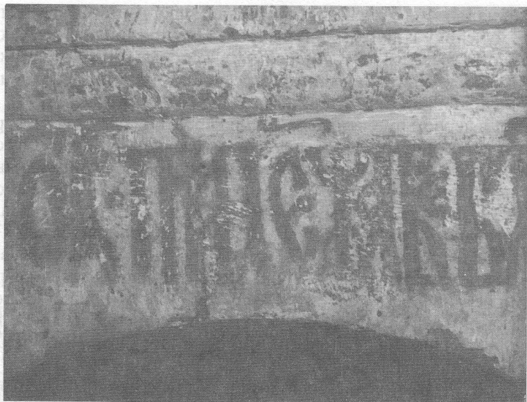
Фрагмент надписи. 1976 г.