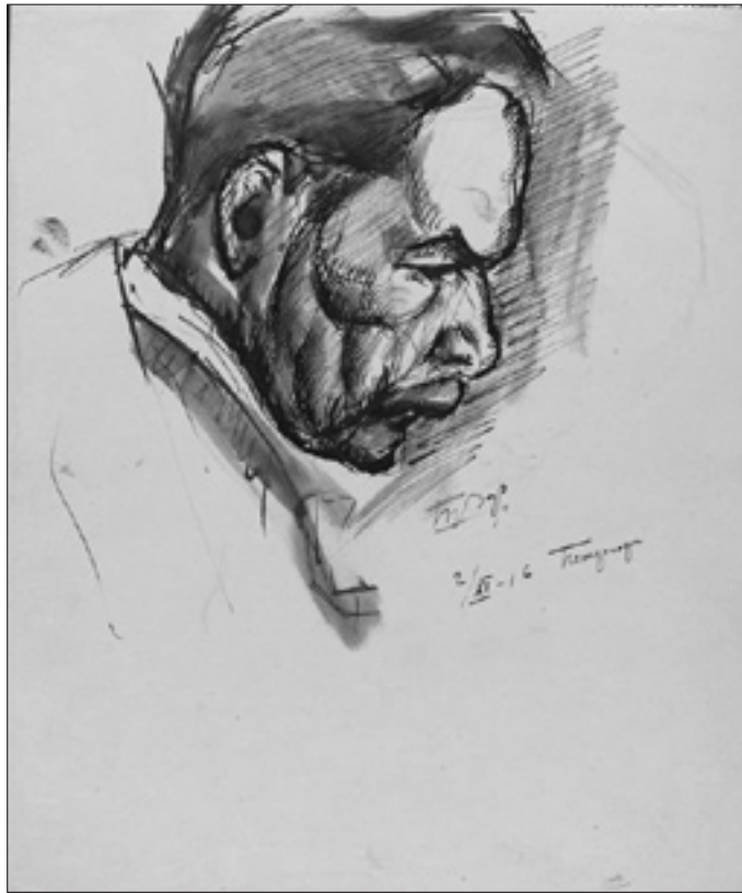
Рис. 2. Браз О.Э. А.И.Анисимов. 2 ноября 1916 г. Петергоф. Бумага, тушь, перо, кисть. 19,8 x 16,8. ГТГ. Инв. 20235