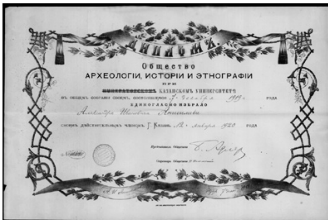
Рис. 6. Диплом А.И.Анисимова об избрании его 7 декабря 1919 г. действительным членом Общества археологии, истории и этнографии при Казанском университете. ОР ГТГ. Ф. 68. Д.182. Л.1. Публикуется впервые