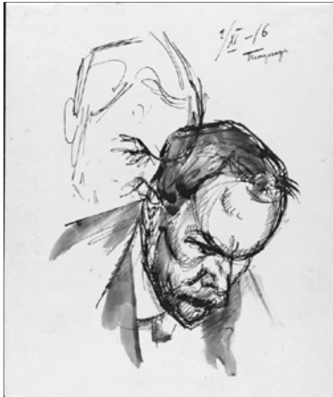
Рис. 3. Браз О.Э. А.И.Анисимов. 2 ноября 1916 г. Петергоф. Бумага, тушь, перо, кисть. 19,8 x 16,8. ГТГ. Инв. 20238. Воспроизведение публикуется впервые